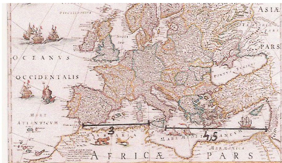
Carte de 1615

Soucieux d'obtenir encore plus de précisions, Peiresc fit réaliser, en 1636, par le célèbre graveur Mellan, installé en haut de la Sainte Baume avec Gassendi, une carte de la lune. (C'était une « première » dans l'histoire de l'astronomie) Ainsi le « top » lors d'une autre éclipse pourrait être encore mieux précisé. Mais la mort, en 1637, l'empêcha de continuer son travail sur les longitudes