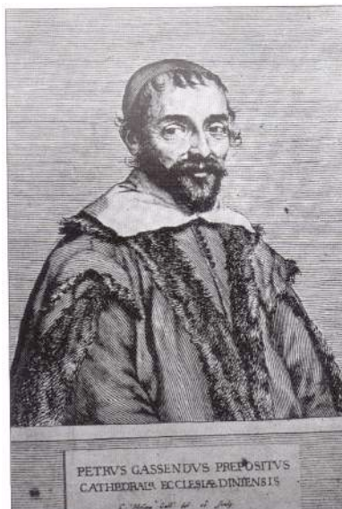
Figure 2 - Gassendi. Portrait anonyme. Ecole française du xvii e siècle. Huile sur bois. Musée de Digne.

Colbert saura souvent faire venir de l'étranger : Huygens de Hollande, célèbre pour ses découvertes d'optique et de mécanique, Cassini du pays niçois italien, fondateur de l'Observatoire de Paris, et Roemer du Danemark qui le premier mesurera la vitesse de la lumière à partir des satellites de Jupiter. Newton refusera l'invitation de Colbert.